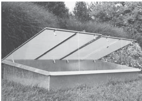
PC-Fenster mit praktischen Fensterstützen