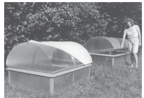
Kombi-Kuppel mit fixem Schutzgitter, aufsetzbarer Polyethylen-Folie, Schattiermatte oder Insektennetz.

Fenster: PC oder Kombi oder Lichtkuppeln für hohe Pflanzen Lüftungsautomat