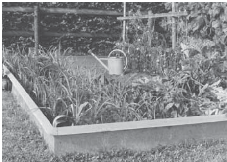
Der Bio-Fix Schneckenzaun hält die Schnecken zuverlässig ab