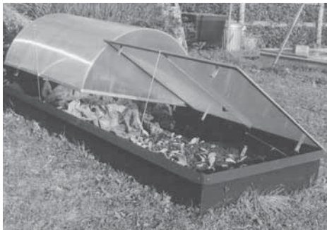
PC-Kuppel und PC-Fenster aus Polycarbonat

Fenster und Lichtkuppeln schützen Ihr Frühlingsgemüse gegen die Kälte und das Wintergemüse gegen den Schnee.