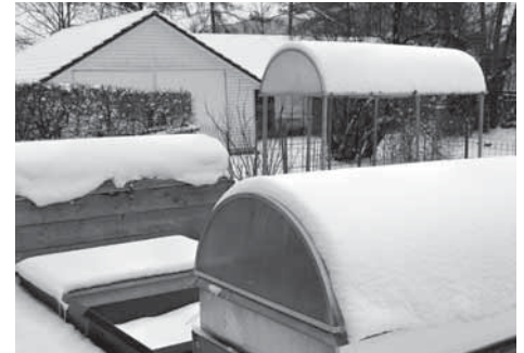
Hochbeet mit Kuppel

Fenster und Lichtkuppeln schützen Ihr Frühlingsgemüse gegen die Kälte und das Wintergemüse gegen den Schnee.